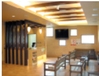
広々とした待合室スペース