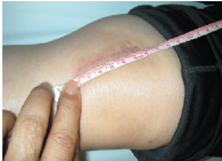
人工膝関節置換術は約5cmと傷口が小さい