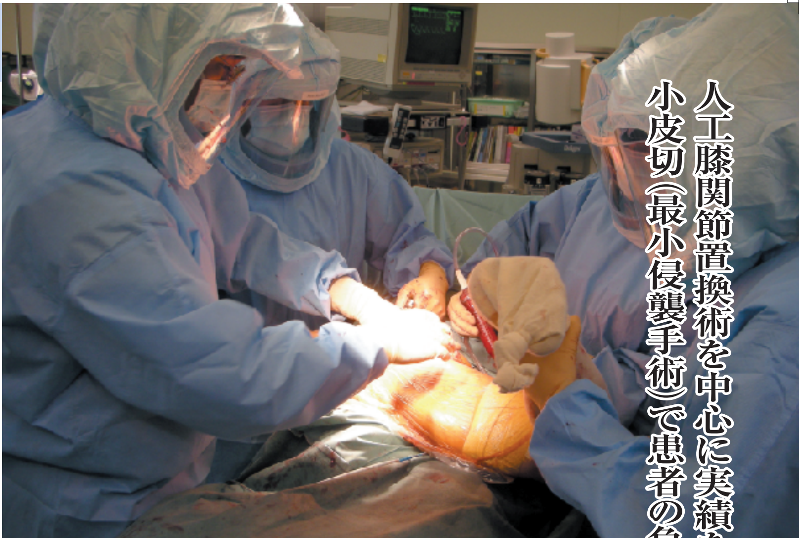
チーム医療で小皮切の人工膝関節置換術を行う

膝関節は構造上、複数の靭帯がつながっているなど複雑で、手術には多大な注意を要する。小皮切は、小さな切開部を通して関節の隅々まで確認しながら手術器具を入れるため、医師の経験や技量に大きく左右される。小さい切開で筋肉をできるだけ傷つけないように手術するため、術後の回復が早く、整容面でも優れている。また、表皮の下に真皮を細かく縫い合わせる真皮縫合により傷が目立たず、外見の不安も解消できる。小皮切は、術後のリハビリにも効