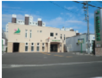
桑園整形外科の外観